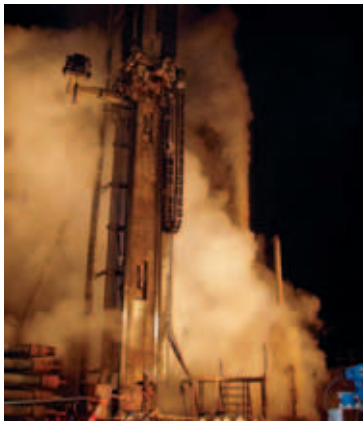
Fündigkeit: 150 l/s; 122° C Drilling Success: 150 l/s; 122° C